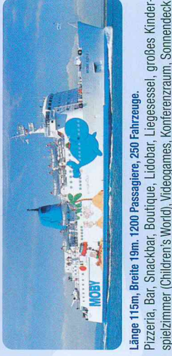
Länge 115m, Breite 19m, 1200 Passagiere, 250 Fahrzeuge.

Pizzeria, Bar, Snackbar, Boutique, Lidobar, Liegesessel, großes Kinderspielzimmer (Children's World), Videogames, Konferenzraum, Sonnendeck, Klimaanlage, Stablisatoren. Das einzige Schiff der Welt, dessen Außenbemalung von "Mordillo" entworfen wurde.