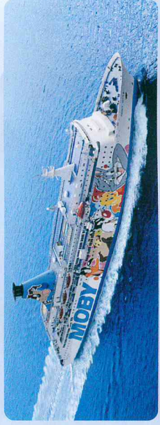
Kategorie: Fast Cruise Ferry - Passagiere: 1.900 - Fahrzeuge: 500 Länge 185m, Breite 27m, Geschwindigkeit 27kn.

400 Kabinen mit DU/WC (teilweise Etagenbetten), Kabinen und Suiten V-Class mit Farb-TV, Radio, Minibar, Fön, Liegesessel, Seifservice-Restaurant, à la carte-Restaurant, Pizzapoint, Admirals-Pub, Eissole, Showlounge, Children's World mit Videospielen und Großbild-TV, Panoramabar, Pool mit Sonnendeck und Lidobar, Satellitenempfang für SKY Sport- und Unterhaltungsprogramme, Stablisatoren und Klimaanlage, ISPS-Code zertifiziert (International Ship and Port facility Security code), Bemalte Außenwände mit dem Thema "Looney Tunes".