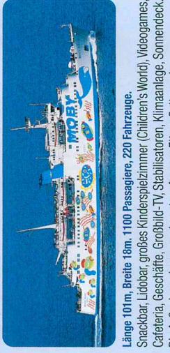
Länge 101m, Breite 18m, 1100 Passagiere, 220 Fahrzeuge.

Snackbar, Lidobar, großes Kinderspielzimmer (Children's World), Videogames, Cafeteria, Geschäfte, Großbild-TV, Stablisatoren, Klimaanlage, Sonnendeck. Die Außenbemalung wurde entworfen von Ettore Sottsass jr.