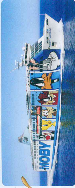
Kategorie: Fast Cruise Ferry - Passagiere: 2.200 - Fahrzeuge: 750 Länge 175m, Breite 27m, Geschwindigkeit 29kn.

320 Kabinen mit DU/WC, Fön und Radio, Juniorsuiten für 4 Personen, Liegesessel, Panorama-Showlounge über 3 Decks, 4 Cafeterias, à la carte-Restaurant, Seifservice-Restaurant, Pizzapoint, Eissole, Snackbar, Kinderspielerbereich, Pool, Sonnendeck, Sportsbar, Zwingerbereich für Haustiere, Satellitenempfang für SKY Sport- und Unterhaltungsprogramme, Stablisatoren, Komfortklasse, Green Star (SPS-Code zertifiziert (International Ship and Port facility Security code), Bemalte Außenwände mit dem Thema "Looney Tunes".