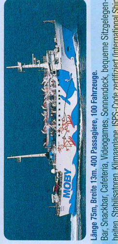
Länge 75m, Breite 13m, 400 Passagiere, 100 Fahrzeuge.

Bar, Snackbar, Cafeteria, Videogames, Sonnendeck, bequeme Sitzgelegenheiten, Stablisatoren, Klimaanlage, ISPS-Code zertifiziert (International Ship and Port facility Security code), M/N Giraglia: die Außenbemalung wurde entworfen von "Studio Grassi Associati".