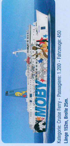
Kategorie: Cruise Ferry - Passagiere: 1.200 - Fahrzeuge: 450 Länge 152m, Breite 25m.

Kabinen mit DU/WC, Liegesessel, Showlounge, Seifservice-Restaurant, à la carte-Restaurant, Pizzapoint, Admirals-Pub, Snackbar, Shopping area mit Verkauf von korsischen Produkten, Children's World mit Videospielen, Zwinger für Haustiere, Klimaanlage, ISPS-Code zertifiziert (International Ship and Port facility Security code), Bemalte Außenwände mit dem Thema Looney Tunes.