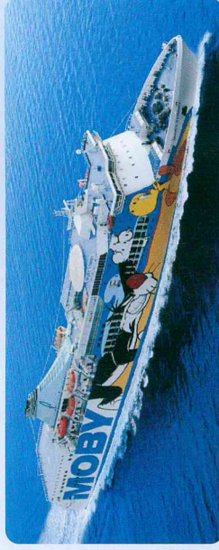
Kategorie: Fast Cruise Ferry - Passagiere: 2.200 - Fahrzeuge: 1.000 oder 2.000 lineare Frachtmeter Länge 212m, Breite 25m, Geschwindigkeit 30kn.

Kabinen mit DU/WC, Liegesessel, à la carte-Restaurant, Seifservice-Restaurant, Pizzapoint, Eissole, Cafeteria, Sportsbar, Admirals-Pub, Children's World mit Videospielen und Großbild-TV, Geschäft, Pool mit Sonnendeck, Helpport, Satellitenempfang für SKY Sport- und Unterhaltungsprogramme, Stablisatoren und Klimaanlage, ISPS-Code zertifiziert (International Ship and Port facility Security code), Bemalte Außenwände mit dem Thema "Looney Tunes".