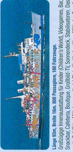
Länge 93m, Breite 16m, 800 Passagiere, 160 Fahrzeuge.

Großzügige Innenausstattung für Kinder (Children's World), Videogames, Bar, Snackbar, Cafeteria, Boutique, Großbild-TV, Sonnendeck, Stablisatoren. Das erste Schiff im Mittelmeer mit viel Platz für Kinder (über 30% der Gesellschaftsräume). Die Außenbemalung wurde entworfen von Ettore Sottsass jr.