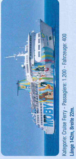
Kategorie: Cruise Ferry - Passagiere: 1.200 - Fahrzeuge: 400 Länge 142m, Breite 22m.

Klimaanlage, Kabinen mit DU/WC und Fön, Suiten, Familiensuiten für 4 Personen, Liegesessel, à la carte-Restaurant, Seifservice-Restaurant, Cafeteria, Piano-Bar mit Live-Musik, Kinderspielerbereich Children's World, Raum mit Videospielen, Großbild-TV, Swimmingpool und Kinderbecken, Panoramaveranda, Boutique, Sonnendeck, Zwinger für Haustiere, Satellitenempfang für SKY Sport- und Unterhaltungsprogramme, Stablisatoren, ISPS-Code zertifiziert (International Ship and Port facility Security code), Bemalte Außenwände mit dem Thema "Looney Tunes".