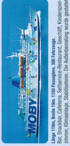
Länge 119m, Breite 19m, 1150 Passagiere, 300 Fahrzeuge.

Bar, Snackbar, Cafeteria, Seifservice-Restaurant, Geschäft, Kinderspielzimmer, Klimaanlage, Stablisatoren. Die Außenbemalung wurde gestaltet vom Projekt Silver und zeigt Bilder von "Lupo und seinen Freunden".