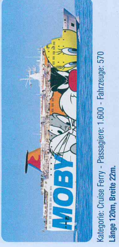
Kategorie: Cruise Ferry - Passagiere: 1.600 - Fahrzeuge: 570 Länge 120m, Breite 22m.

Bar, Cafeteria, Snackbar, Seifservice-Restaurant, Geschäft, Kiosk, Videogames, Kabinen, Liegesessel, Kinderspielzimmer, Sonnendeck, Lidobar, Klimaanlage, Satellitenempfang für SKY Sport- und Unterhaltungsprogramme, Stablisatoren, Zwinger für Haustiere, ISPS-Code zertifiziert (International Ship and Port facility Security code), Bemalte Außenwände mit dem Thema "Looney Tunes".